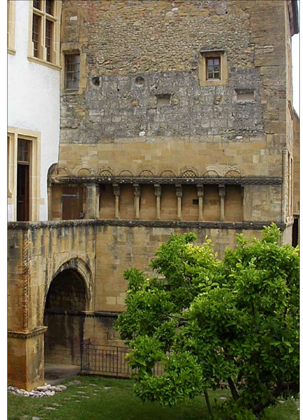
Ansicht der Fassade vor der Restaurierung