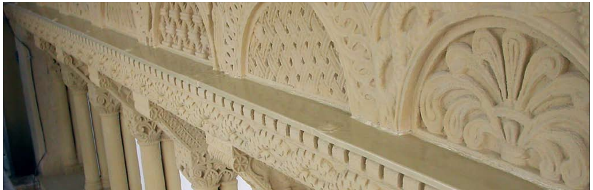
Detail nach der Restaurierung