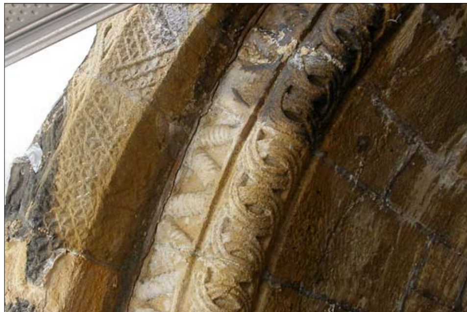
Reinigungsmuster mit unterschiedlichen Mörteln