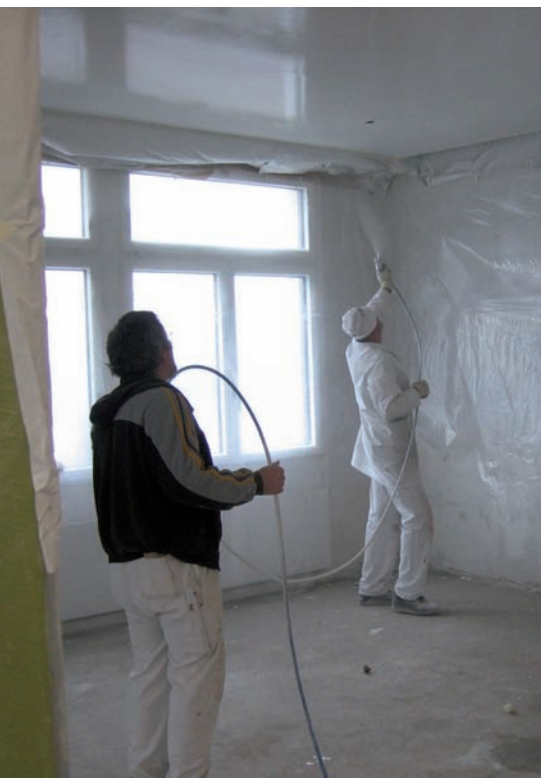
Ein Arbeitsgang reicht in der Regel nicht: Aufgespritzte Beschichtungen sind häufig ungleichmässig.

fläche des Beschichtungsfilms. Die meisten Beschichtungen sind nämlich nicht vollständig matt – sie verfügen, vor allem im Streiflicht, über einen schwachen Seidenglanz. Dieser hängt von der Mikro-Rauigkeit der Beschichtungs Oberfläche ab. Schon geringe Unterschiede in dieser Feinstruktur wirken sich auf die Reflexionseigenschaften der Beschichtungs Oberfläche aus. Im Streiflicht können so Unregelmässigkeiten erscheinen.