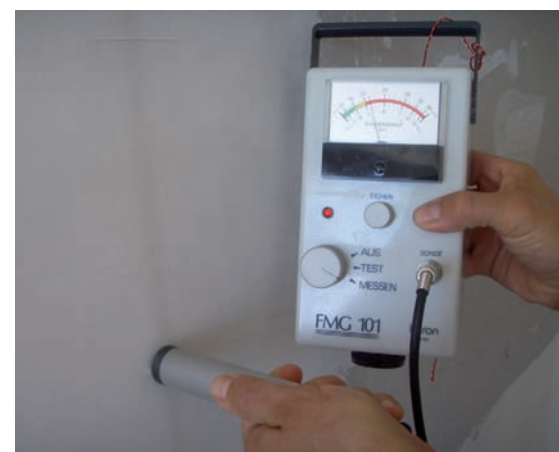
Das Prüfgerät bringt's ans Licht: Gips bindet gerne Wasser.

Bezeichnend ist, dass praktisch nie Probleme auftreten, wenn die Maler- und Gipserarbeiten aus einer Hand kommen. Ein Verarbeiter, der beide Arbeitsgänge ausführt, weiss, worauf er zu achten hat. Diesbezüglich sind hier auch die Bauherrschaft bzw. der Planer gefragt, die mit ihrer Suche nach dem günstigsten Angebot das Risiko von Fehlleistungen erhöhen.